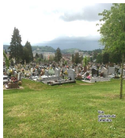
Vue générale du cimetière